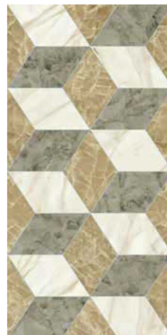
0014142 60x120 cubical avorio lux 3D