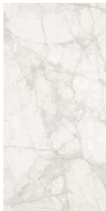
0015280 60x120 bianco dolomiti lux 3D