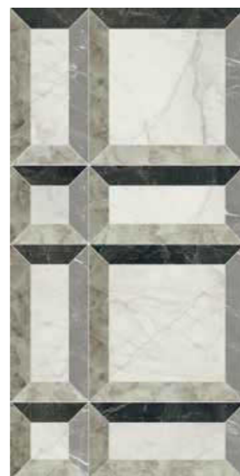
0014088 60x120 frame nero lux 3D