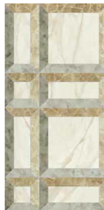
0014087 60x120 frame avorio lux 3D