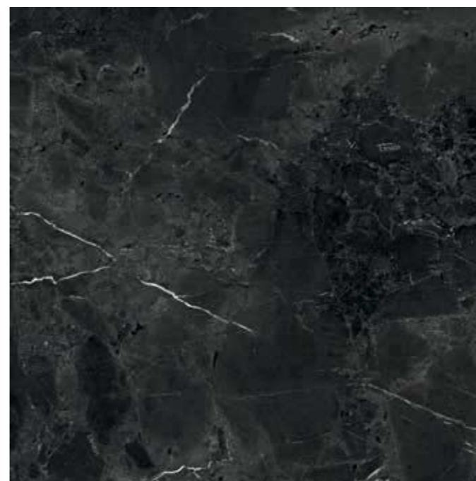
0015279 120x120 nero imperiale lux 3D