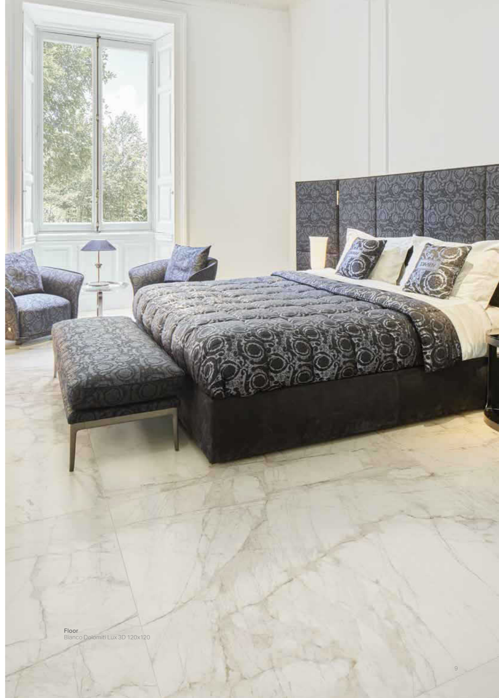
Floor Bianco Dolomiti Lux 3D 120x120