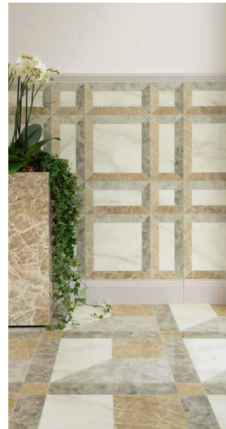
Fuga consigliata 1 mm 1 mm suggested joint