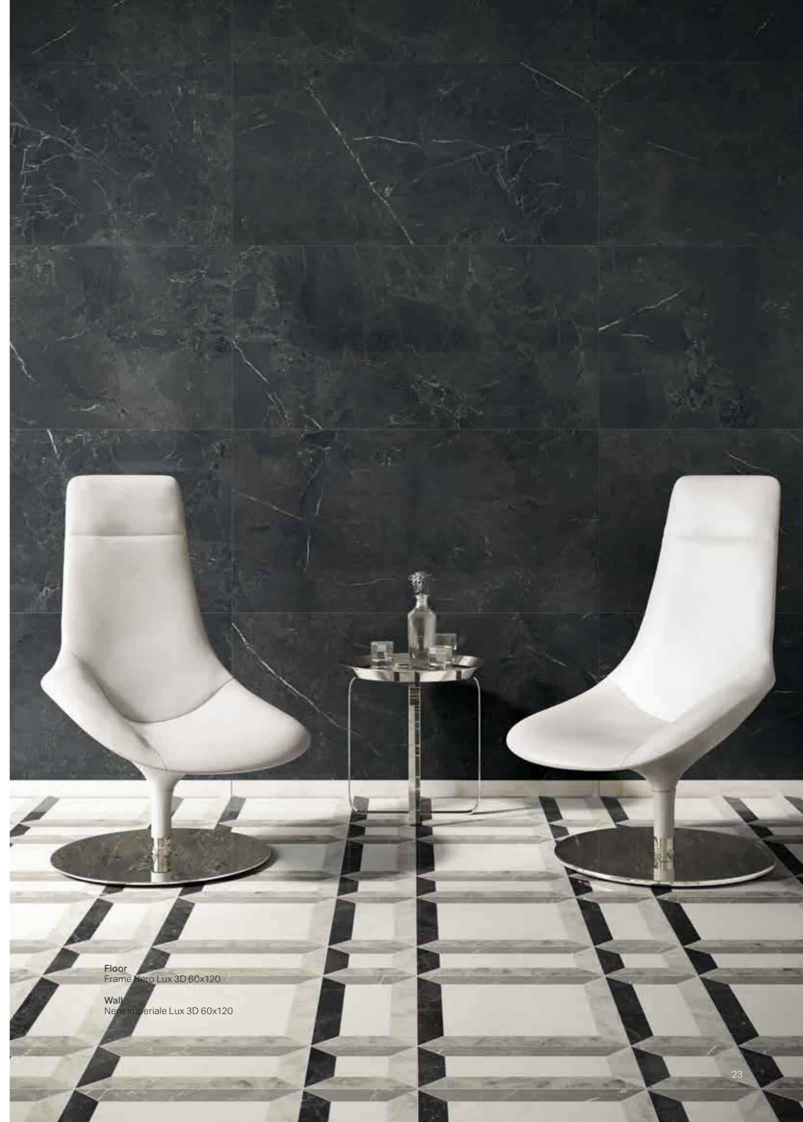
Floor Frame Nero Lux 3D 60x120