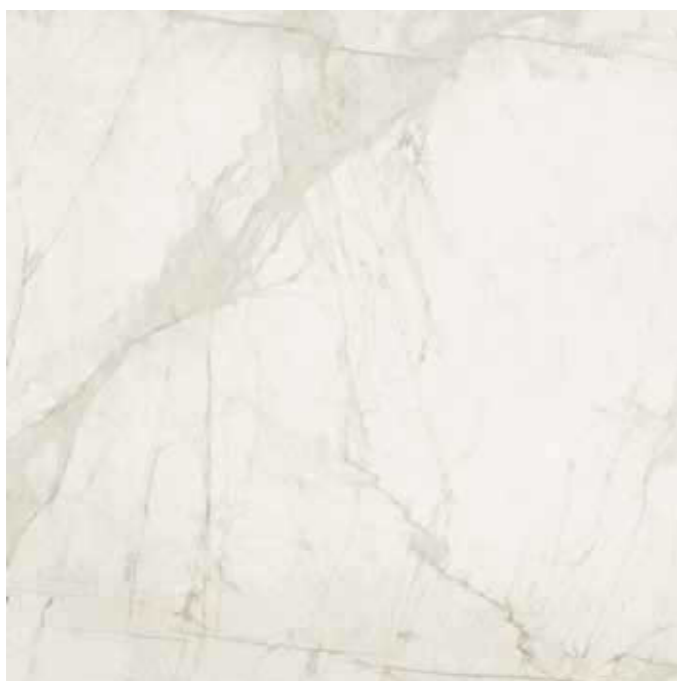
0015277 120x120 bianco dolomiti lux 3D