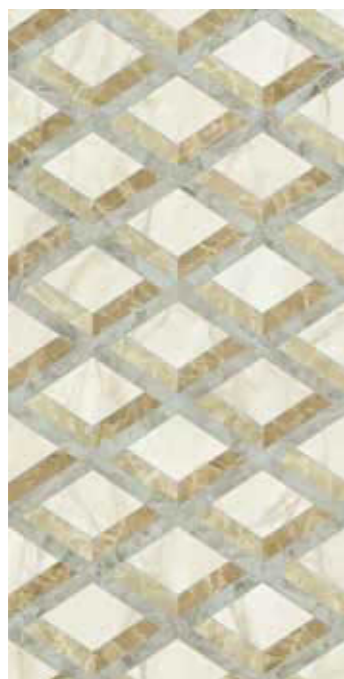
0014144 60x120 lozenge avorio lux 3D