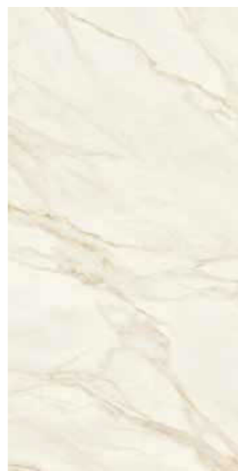
0015281 60x120 avorio apuano lux 3D