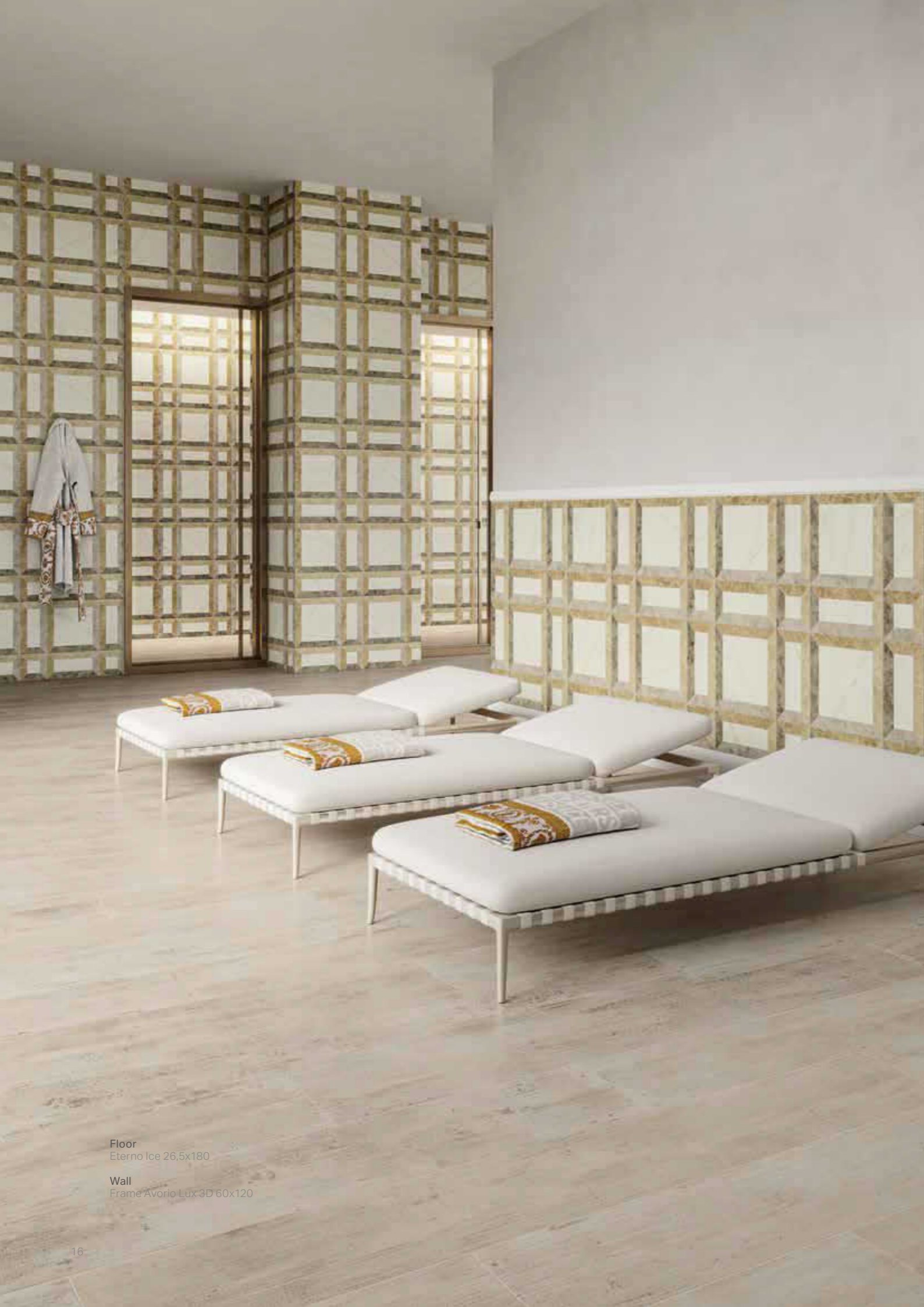
Floor Eterno Ice 26,5x180