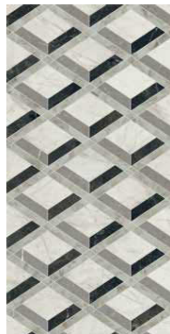
0014145 60x120 lozenge nero lux 3D