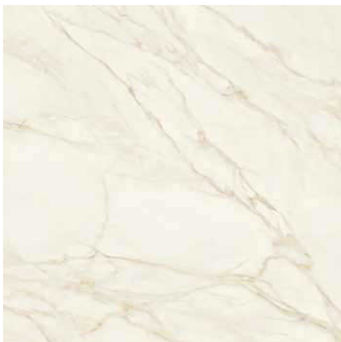
0015278 120x120 avorio apuano lux 3D