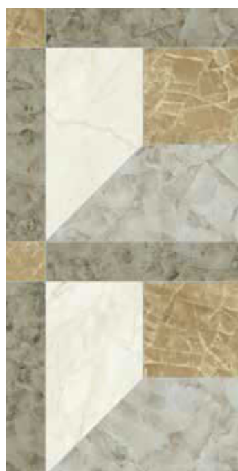
0014091 60x120 prospect avorio lux 3D