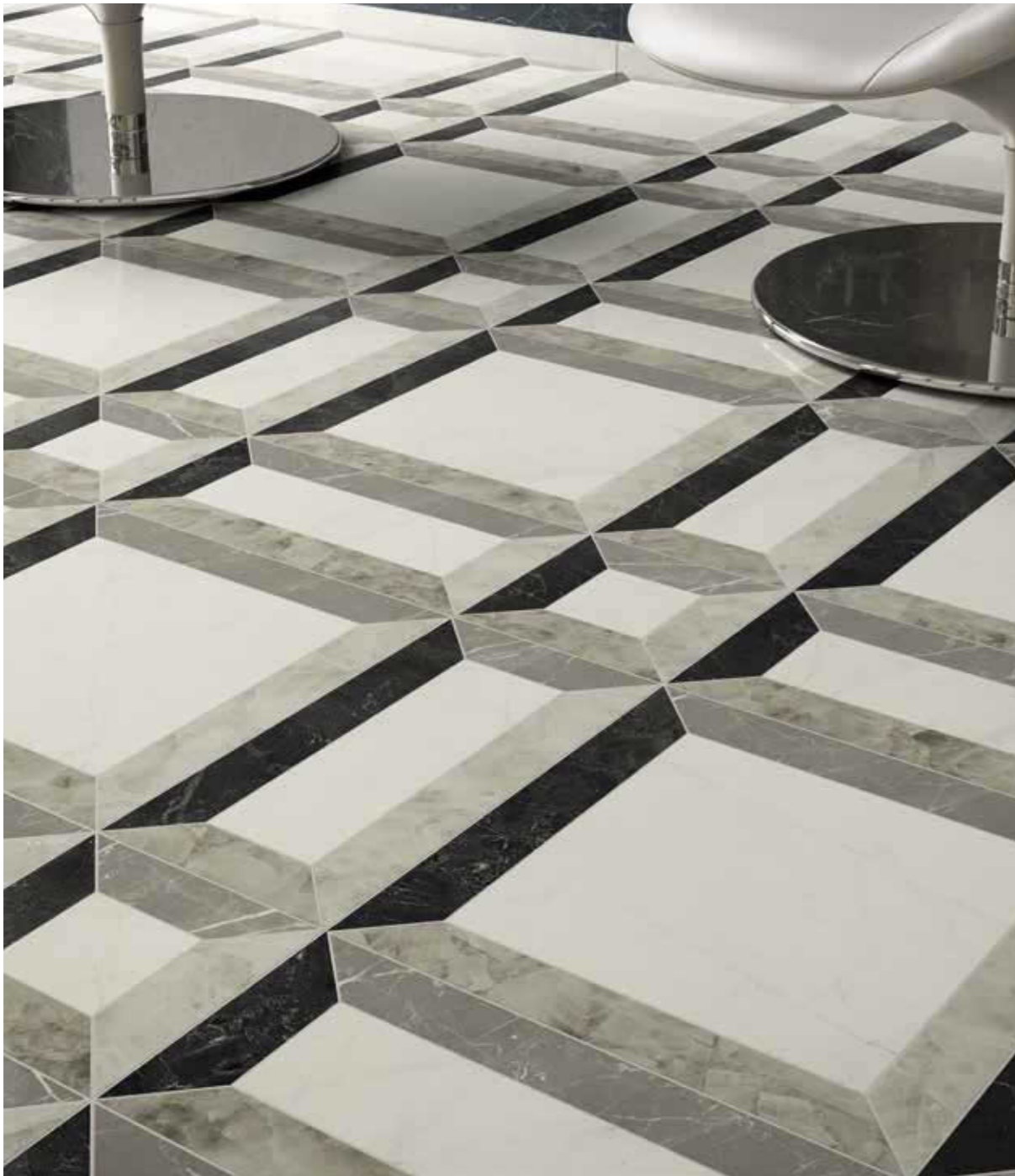
Floor Frame Nero Lux 3D 60x120