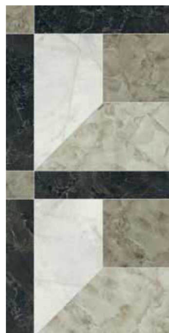
0014092 60x120 prospect nero lux 3D