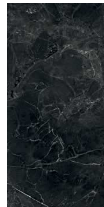
0015282 60x120 nero imperiale lux 3D