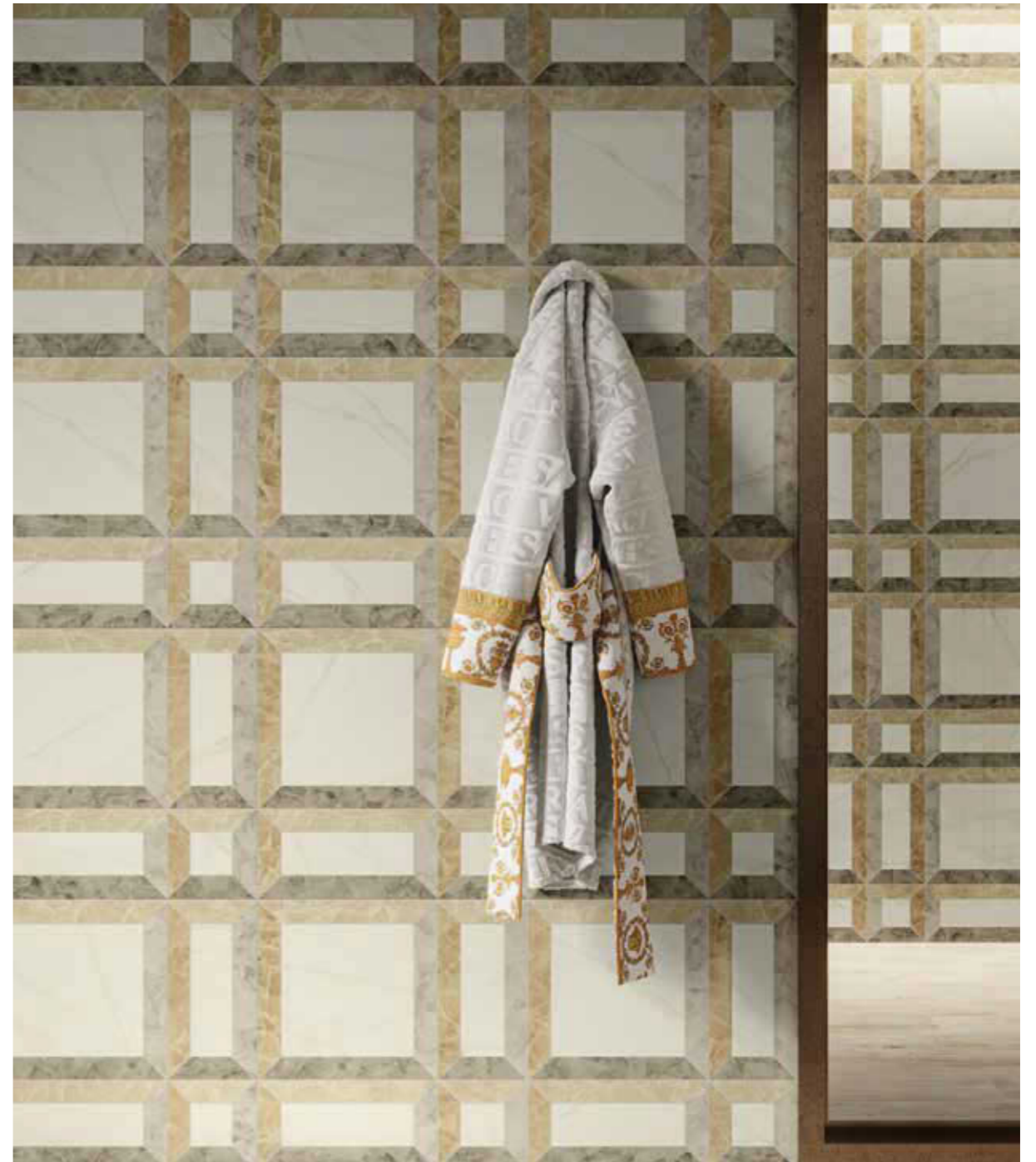
Wall Frame Avorio Lux 3D 60x120