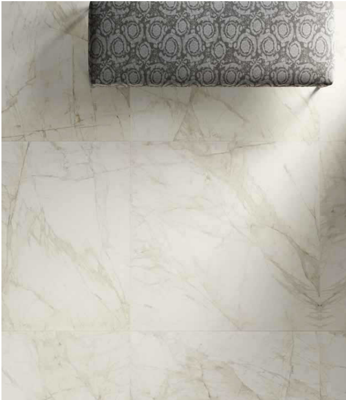
Floor Bianco Dolomiti Lux 3D 120x120